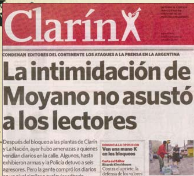
Diario Clarin 08/11/2009

¿Cómo se puede tan descaradamente plantearse «falta de libertad de expresión» al pedido de que se cumpla con un acta firmada 10 meses atrás? ¿En qué cabeza cabe que se diga que la protesta de los camioneros tuvo «forma de ejercicio totalitario de poder», cuando estos grupos económicos metidos en el negocio del periodismo colonial nada dijeron en aquellos tiempos, en que la dictadura secuestraba y desaparecía a más de 100 hombres y mujeres de prensa? El «gran diario» ataca como grupo de poder pero se escuda como defensor de la libertad de prensa.