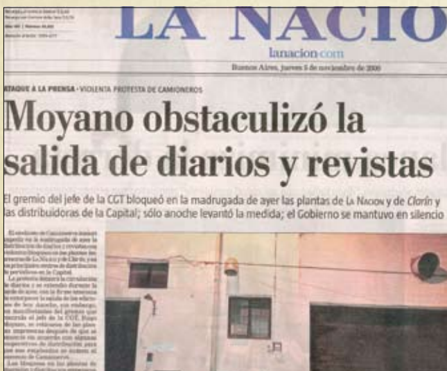
Diario La Nación 05/11/2009

Son, en más de un sentido, los auténticos decadentes, los nuevos profetas del odio. Pero las falacias que siembran ya no tienen posibilidad de germinar. Esta es la hora de los trabajadores. Y los que quieran enfrentarse a ellos deberán entender que aunque tengan las principales armas a su disposición; la verdad, la verdad que nos asiste como dirigentes sindicales no sólo es más fuerte que el poder de fuego que detentan sino que además nos convierte en hombres libres.