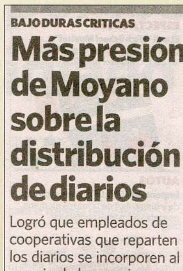
Diario Clarin 05/11/09