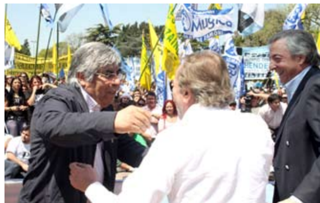
QUINTA DE SAN VICENTE 17 DE OCTUBRE

Del acto formaron parte además funcionarios nacionales, provinciales, intendentes, legisladores, gremialistas y agrupaciones políticas. Tampoco faltaron durante la tarde las menciones a Leopoldo Marechal, Arturo Jauretche y Raúl Scalabrini Ortiz, notables intelectuales que en su momento acompañaron y apoyaron el proyecto del General Perón y contribuyeron con sus ideas y reflexiones a sentar las bases de un verdadero pensamiento nacional.