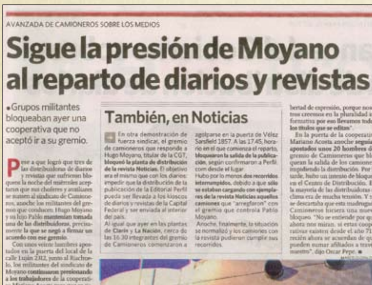
Diario Clarin 06/11/2009

Esas mascotas que se prestan al juego sucio bien harían en mirarse a sí mismos para advertir el triste papel que cumplen, porque ya les llegará el momento en que -cuando no cumplan como marionetas lo que el gran titiritero les indica-, serán destratados de la misma manera como destratan a quienes luchan por el respeto a la condición humana de los trabajadores.