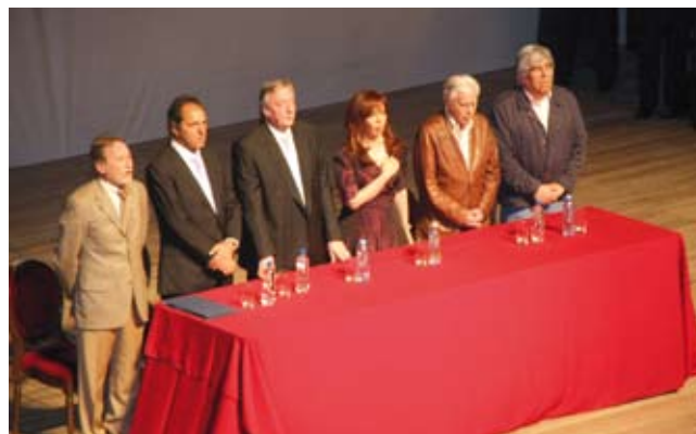
TEATRO ARGENTINO DE LA CIUDAD DE LA PLATA