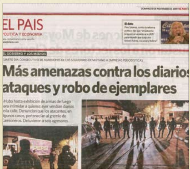
Diario Clarin 08/11/09