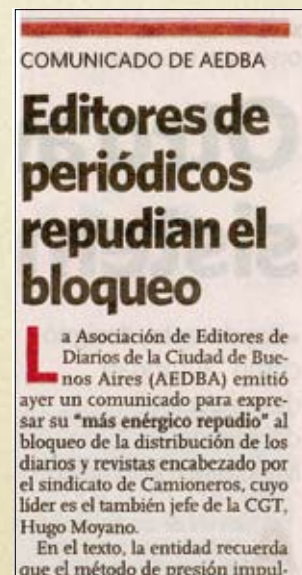
Diario Clarin 06/11/09